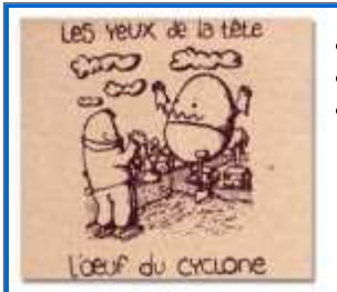
Les Yeux de la Tête - "l'oeuf du cyclone" Petit Label - PL 009