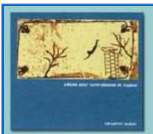
Benjamin Duboc - "Pièces pour contrebasse et tuyaux" Petit Label son 001

Deux pièces électroacoustiques de Benjamin Duboc enregistrées en novembre 2005.