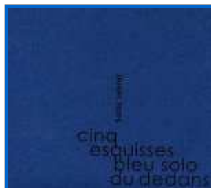
Soizic Lebrat : "cinq esquisses bleu solo du dedans" Petit Label / Les Allumés du Jazz

Le trio composé de J-B Perez, N. Talbot et Maël Guezel invente une musique sauvagement libre. Du hard free gothique (dixit C. Ducasse) ?