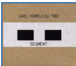
Gaël Horellou : "Segment" Petit Label / Les Allumés du Jazz