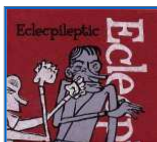
Eclectileptic Petit Label / Les Allumés du Jazz

Intensité, écoute, générosité. Une seule pièce, comme un grand souffle commun par un trio qui élargit la dimension sonore du trio piano-basse-batterie. Fidélité absolue aux principes du free !