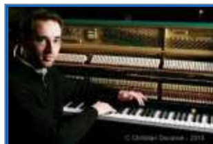
François CHESNEL

Toutefois, le Petit Label repose sur un projet organisé et structuré. C'est ainsi que, pour mieux baliser le parcours des auditeurs dans un catalogue qui s'étoffe rapidement, il propose quatre collections qu'on distingue par la couleur de base de leur pochette :