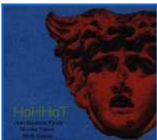
Jean-Baptiste Perez - Nicolas Talbot - Maël Guezel : "HoHHot" Petit Label / Les Allumés du Jazz