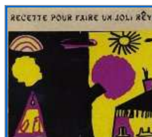
"Recette pour faire un joli rêve" : élèves d'Épinay sur Odon Petit Label / www.petitlabel.com

Le Petit Label s'implique aussi dans des actions en milieu scolaire finalisées par la réalisation d'un CD. Ce fut le cas avec les élèves de l'école d'Épinay sur Odon dans le cadre d'ateliers de pratique artistique sur le rapport bruit/son intitulé " la musique du hasard ". Une belle recette, tout à fait réussie, en, dix étapes. Un bien joli rêve effectivement !