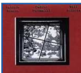
Patrice Grente - Cédric Piromalli - Will Guthrie Petit Label / Les Allumés du Jazz